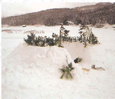
タドリ朝ドリ(南会津町/田島)