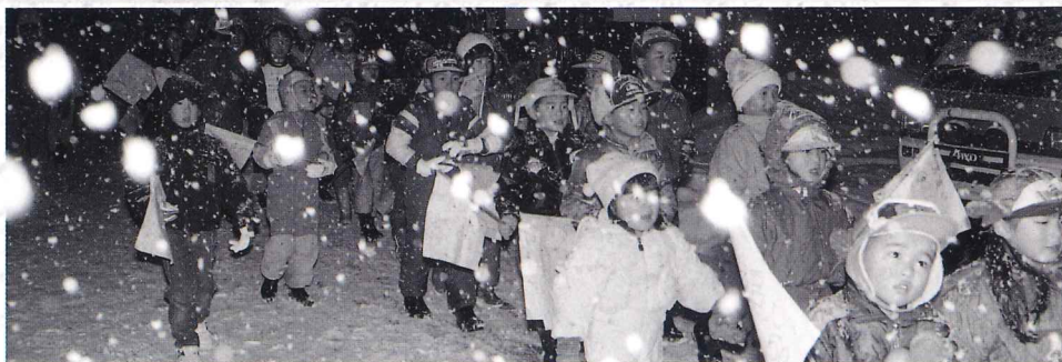
鳥追い(三島町検原)