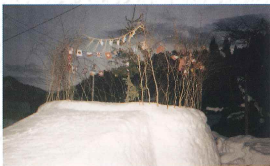
鳥追いのドウ(三島町間方)